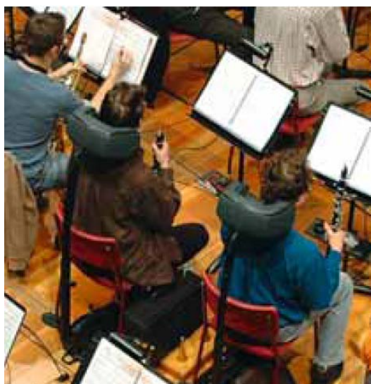
Figura 10. L'Orchestre de la Suisse Romande con gli «Hearwig®».