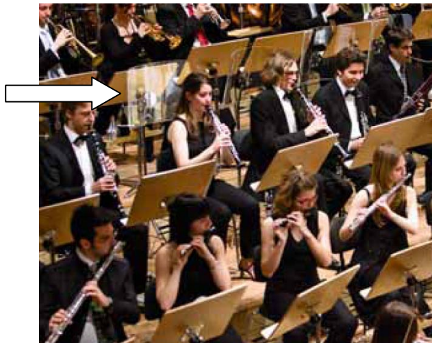
Figura 9. Schweizer Jugend-Sinfonie-Orchester, Zurigo: Schermi in vetro acrilico per musicisti.

I pannelli in vetro acrilico (vedere figura N. 9) schermano i toni di intensità elevata a media-alta frequenza. Nello stesso tempo riflettono il suono. Per evitare tale fenomeno possono essere forniti di trattamento fonoassorbente senza alterarne la trasparenza. Vanno inoltre posizionati in modo da non interferire nella percezione acustica dei musicisti.