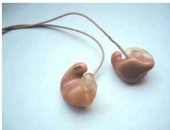
Figura 5. Monitor intrauricolari personalizzati.

Sono inserti auricolari personalizzati con microfoni in miniatura incorporati e un sistema trasmittente/ricevente senza fili fissato su una cintura. Possono sostituire il monitoraggio degli altoparlanti e aiutare a ridurre l'esposizione sul palco e l'eventuale effetto Larsen 6 , in particolare per i musicisti pop. Per evitare l'ascolto di livelli sonori eccessivi, si deve predisporre una attenta regolazione del volume utilizzando sistemi con la funzione limitatrice. Gli inserti auricolari personalizzati devono calzare correttamente, altrimenti possono far entrare il rumore di fondo. Un utilizzo scorretto può indurre l'utente ad alzare il volume, per attenuare il rumore di fondo indesiderato.