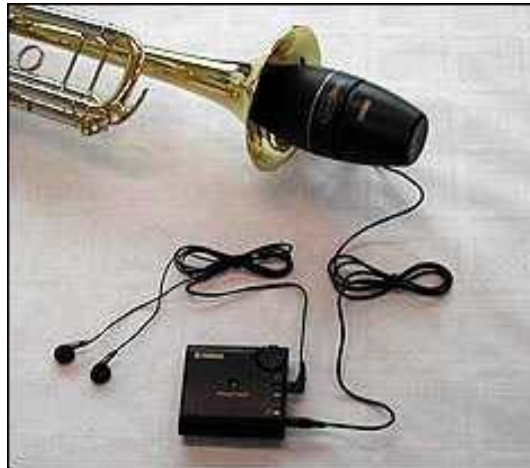
Figura 6. Sordina per tromba.