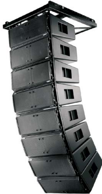
Figura 3. Immagine raffigurante una “Line Array” Questi sistemi di riproduzione sono costituiti da un certo numero di speciali moduli indipendenti (diffusori), sovrapposti verticalmente ed allineati, che operano come una singola sorgente sonora e che, se vengono rispettate alcune condizioni, sommano le loro emissioni in modo coerente.

amplificazione, è il conseguimento di un'alta pressione sonora e una copertura uniforme dell'area di ascolto. Con i sistemi convenzionali, si è spesso cercato di ottenere questo risultato usando diffusori più potenti o in numero elevato, ma queste soluzioni introducono nuovi, ben noti, problemi al personale che si trova nei pressi delle casse acustiche. I sistemi line-array affrontano queste problematiche in un modo diverso senza la necessità di avere enormi potenze acustiche.