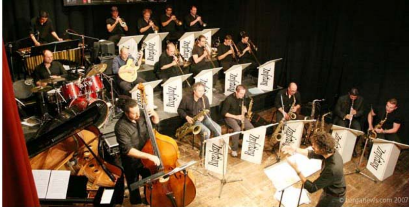
Figura 8. Esempio di disposizione su pedane a diversi livelli degli strumenti a fiato